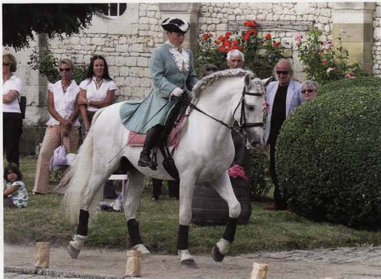
Des démonstrations d'art équestre sont proposées au public lors du festival « Aux Ormes Mozartiens ! »