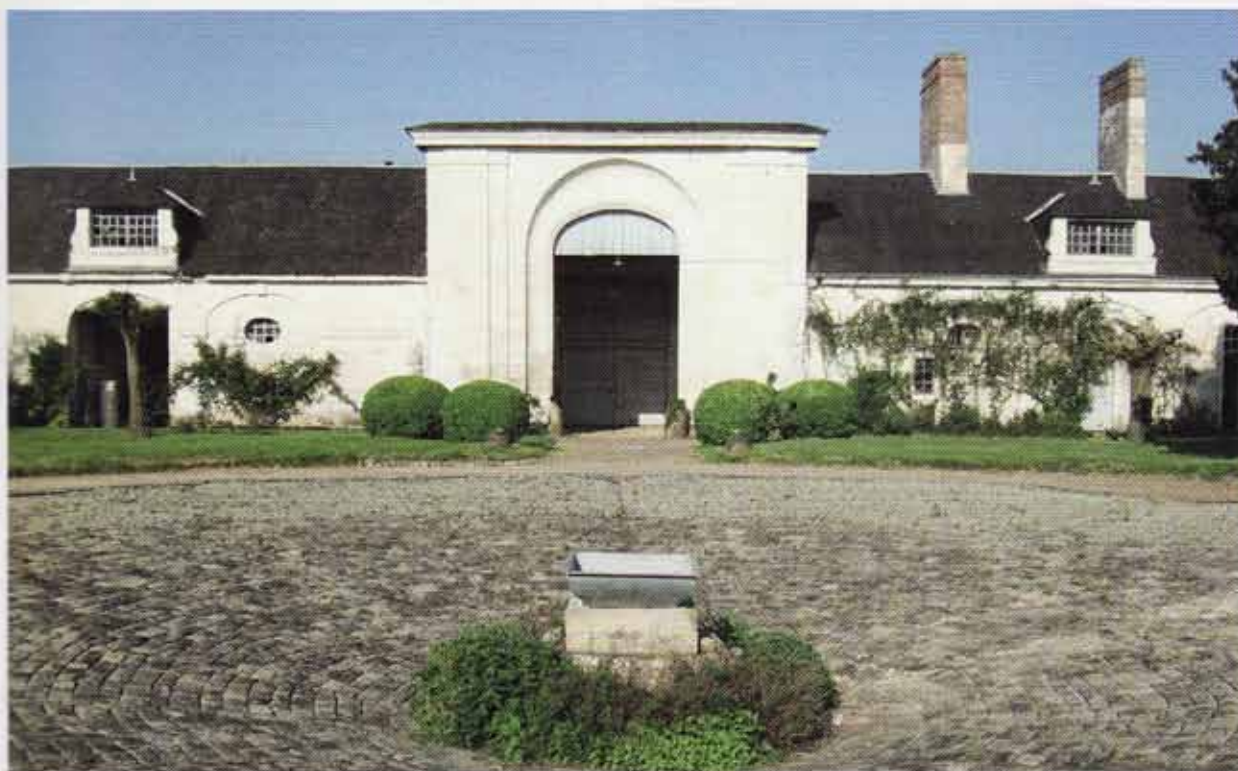
Les pavés de cobblestone, recommandés de 1800 au début du 19 e siècle, ont été révisés - l'histoire de Logivière

Louvois octroie aux maîtres de poste le droit de tenir une auberge comme c'est le cas au relais des Ormes. Au XIX e siècle, le développement des lignes de chemin de fer entraîne la fermeture progressive des relais de poste qui cessent définitivement leur activité en 1873.